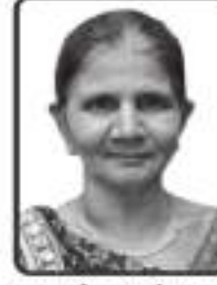
માતૃશ્રી રામુબેન હરખચંદ પાંચાલાલ ગડા