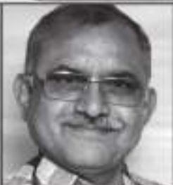
શામજી આસદીર ગડા

પગપાળામાં નામ લખાવવાની છેલ્લી તારીખ : ૦૮.૦૧.૨૦૨૦ સુધી પહેલું સ્ટોપ : પાનેરી - અંધેરી • બીજું સ્ટોપ : પનીહારી - સાંતાક્રુઝ