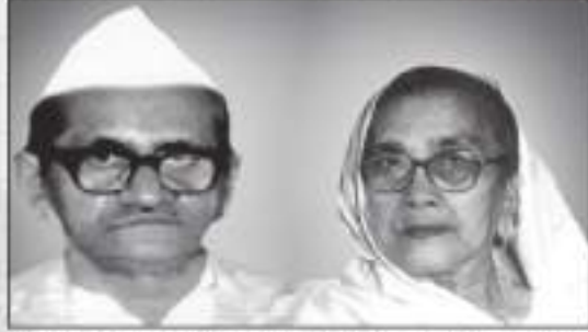
માતૃશ્રી લક્ષ્મીબેન ગોપાલજી શીવજી ગડા